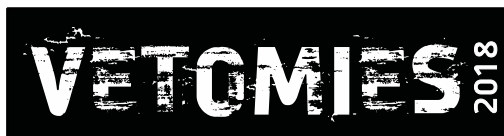
Liite 3. Aikakorttimalli